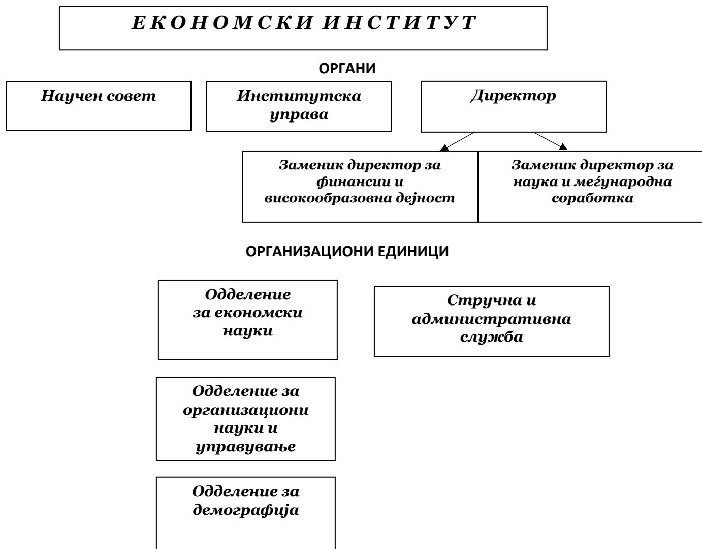
Слика 1 Органограм на Економскиот институт