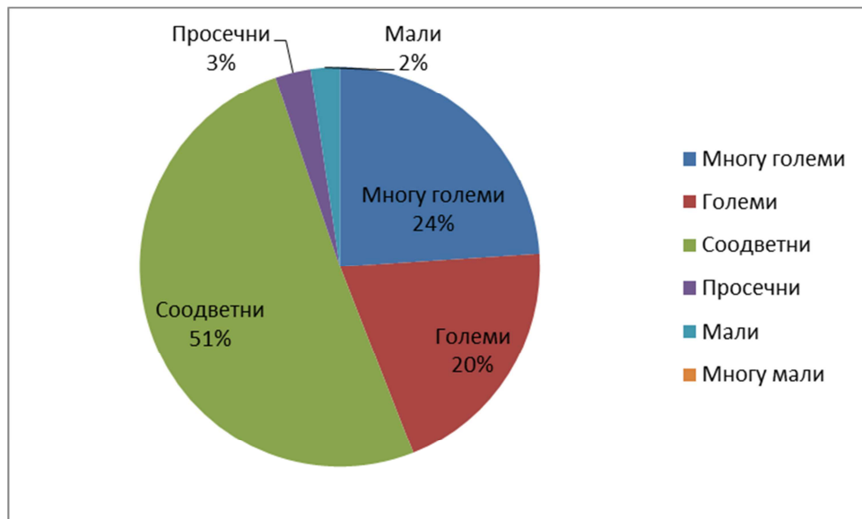
Графикон 1. Барања што се поставуваат пред студентите и тежина на испитот

Како што може да се забележи дека во најголем процент, студентите одговориле дека се поставуваат многу големи барања од страна на професорите, што може да послужи како основа за ревидирање на системот на испитување, спсиокот на задолжителна литература и соодветна селекција на наставните содржини со фокус на содржината и компетенциите кои студентите треба да ги добијат на вториот циклус студии.